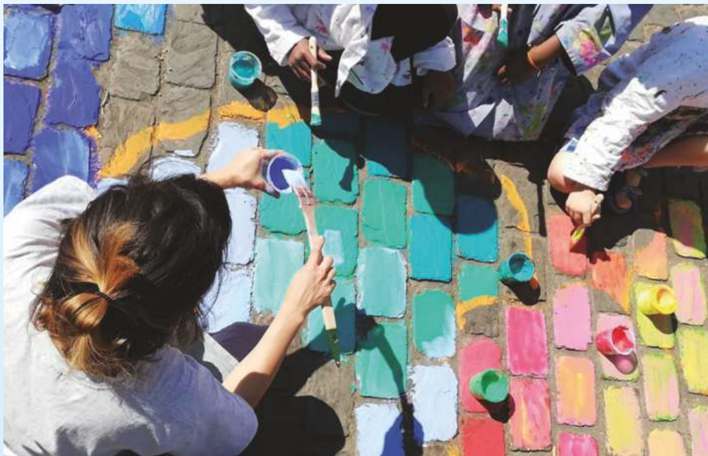
Œuvre collective par l'asbl « Une Maison en Plus » dans le cadre du projet « Colorie la place Saint-Denis », juillet 2020.