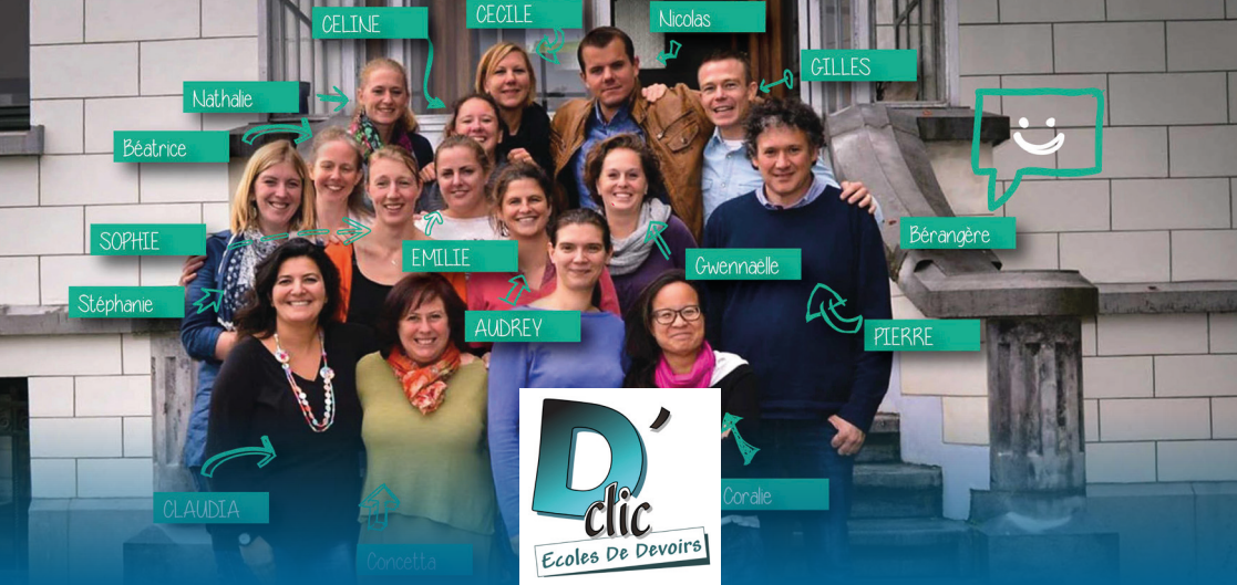
D'CLIC - LA CHOUETTE