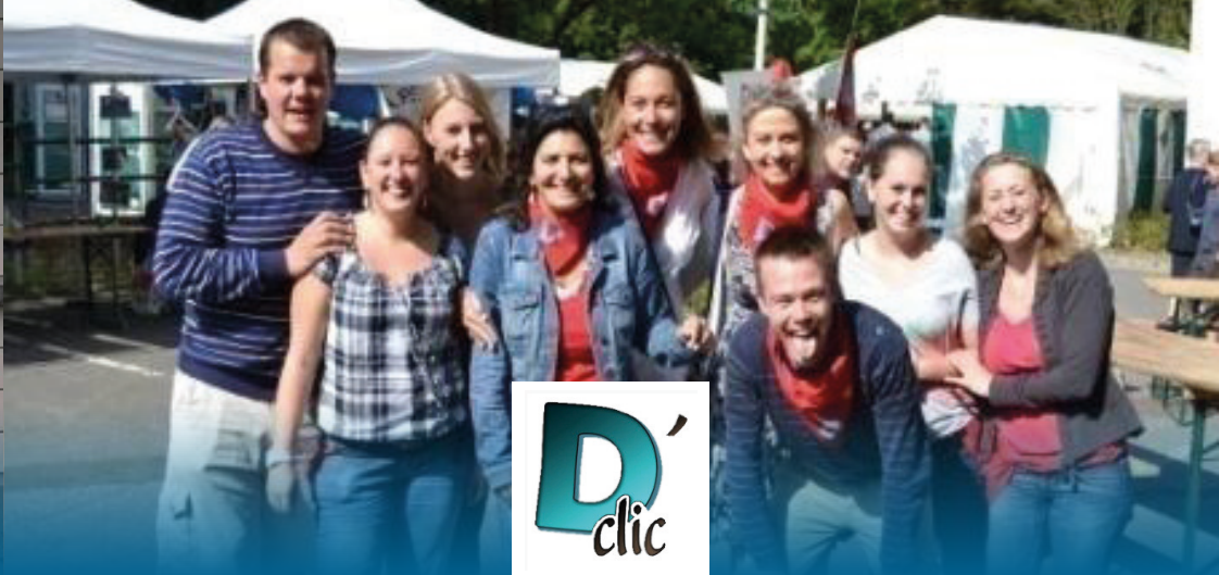
D'CLIC - SYSTÈME D